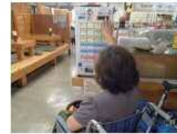
低いボタン位置の券売機