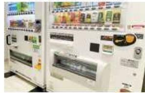
低いボタン位置の自動販売機