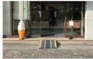
車椅子用可搬型スロープ