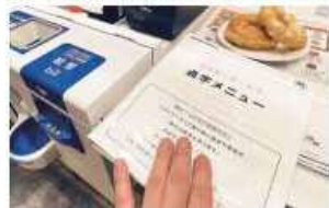
点字・墨字併記のメニュー