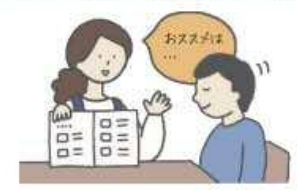
メニューや商品名の読み上げ等