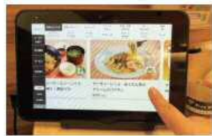
タブレットを活用したメニュー等