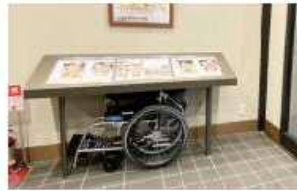
貸出し用の車椅子