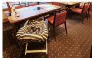
貸出し用の乳児用ベッド