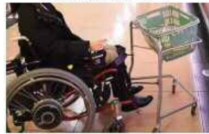
車椅子に連結する買い物カート