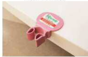
杖を立てかけるホルダー