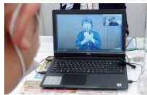
手話サポートテレビ電話