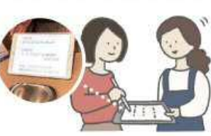
筆談器を活用した会計・対話